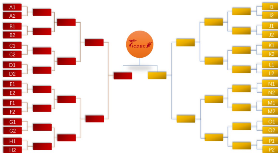
第四届国际混凝土龙舟赛——直线竞速 PK 赛对阵示意图

直线竞速 PK 赛由参赛选手抽签分组进行，每次由两艘龙舟同时进行直线竞速，率先到达终点的队伍获胜，获胜队伍将进入下一轮 PK 赛，次轮的对手将于同区另一组获胜的队伍进行第二轮 PK 赛，直到决出直线竞速 PK 赛的冠军。比赛时，双方龙舟操作选手站于起点前，将龙舟置于指定区域，待裁判信号枪发射后，通过遥控器控制龙舟直线加速前进至通过终点，由工作人员在终点记录各组龙舟完成直线行驶到达终点所耗时间。直线竞速 PK 赛总分 15 分，按照直线竞速名次计分，冠军：15 分，亚军：12.5 分，四强：10 分，八强：7.5 分，十六强：5 分，完赛选手：2.5 分，未完成选手：0 分。并单独设立冠军奖、亚军奖、季军奖。